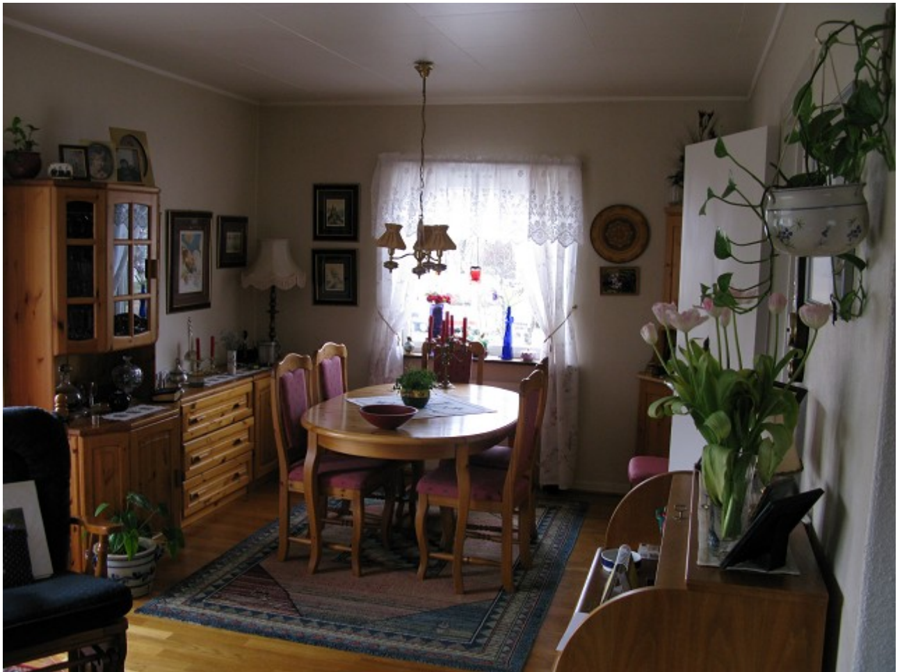
Stue 2. etasje.