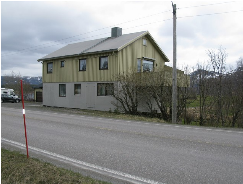
Fasade mot E 10