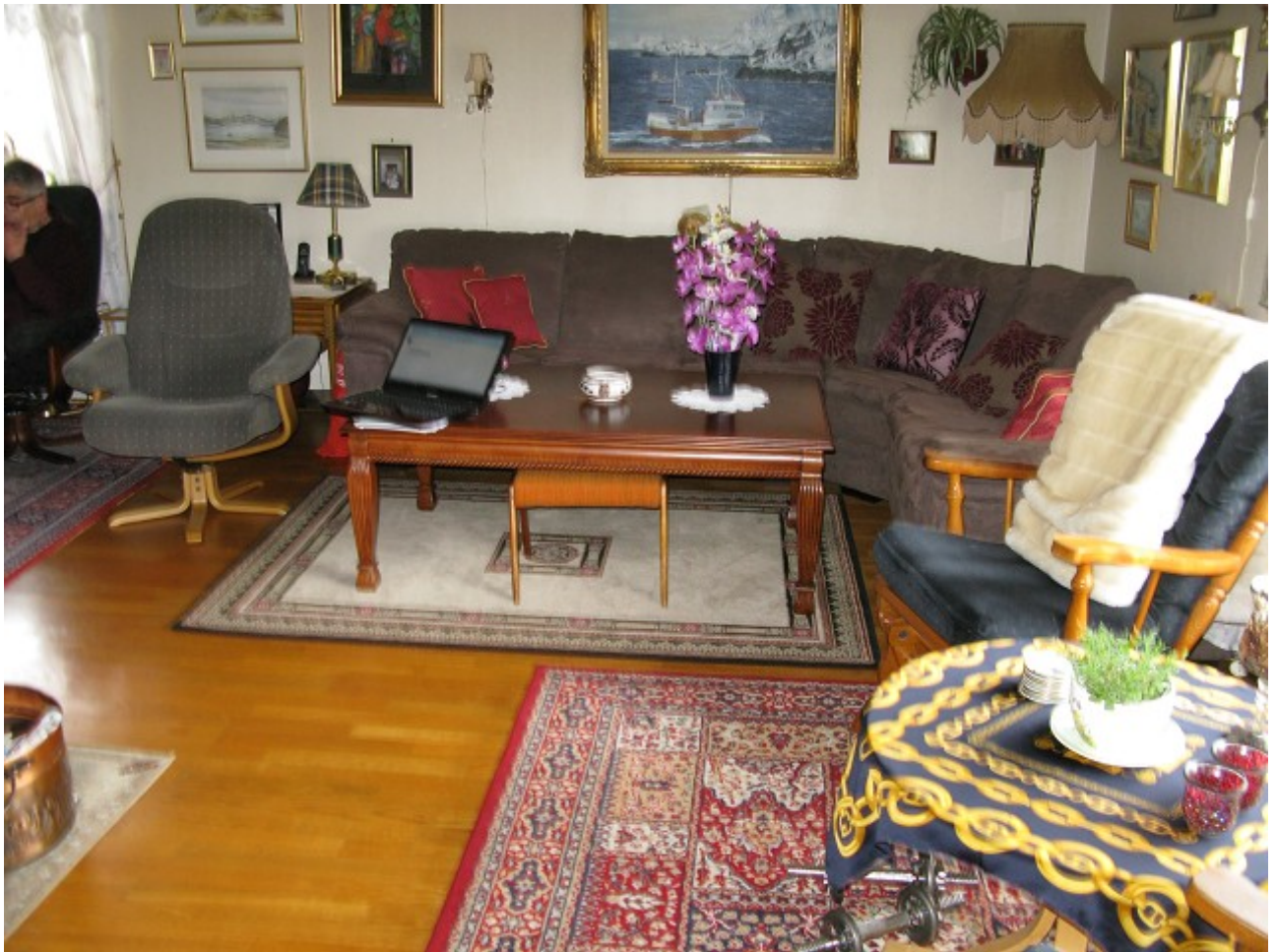
Stue 2. etasje.

Eiendom: Gnr. 72 Bnr. 50 KOMMUNE VESTVÅGØY Adresse: Vikingveien 349, 8360 BØSTAD