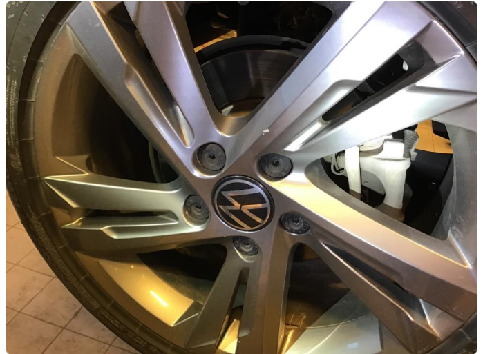
1.2 Skade på felg