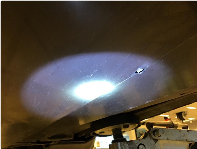
1.1 Beskyttelsesplate skadet/mangler