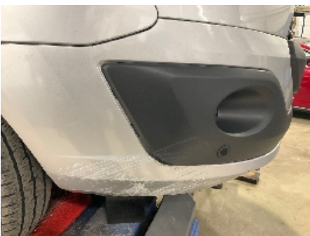
4. Lakk / karosseri utvendig