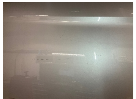
6. Lakk / karosseri utvendig