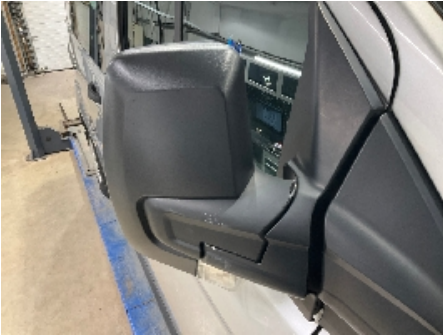
1. Utvendig speil