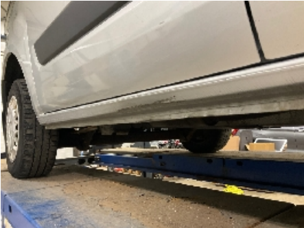
7. Lakk / karosseri utvendig