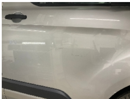
5. Lakk / karosseri utvendig