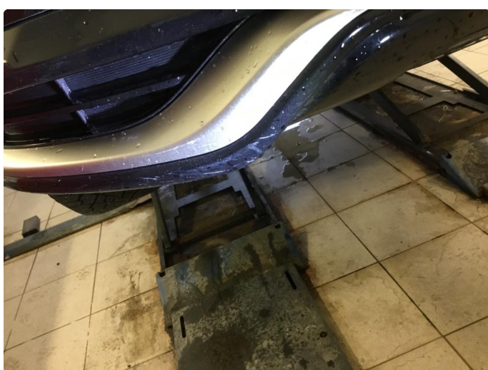
1.3 Ripe(r) ned til grunning