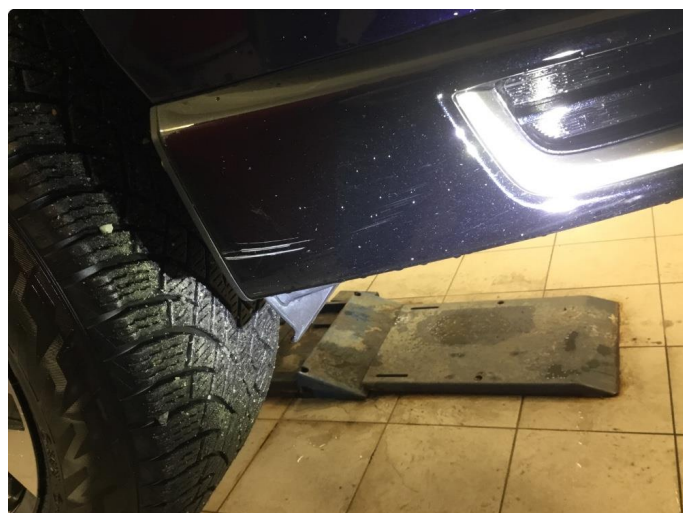
1.3 Ripe(r) ned til grunning