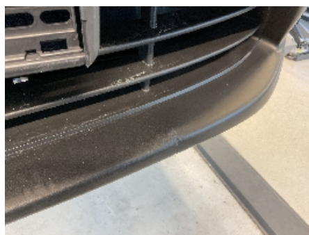
23. Lakk / karosseri utvendig