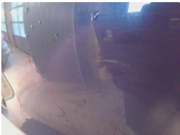
1.1 Lakk flasser