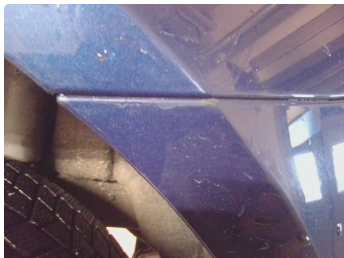
1.1 Lakk flasser