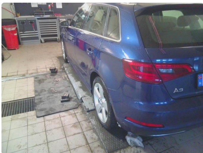
3.1 Øvrige feil