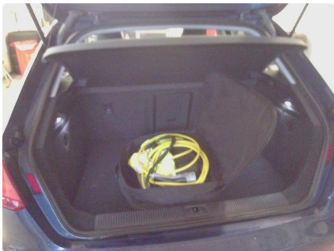
3.1 Øvrige feil