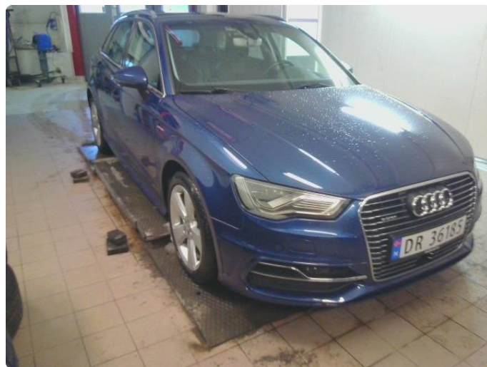
3.1 Øvrige feil