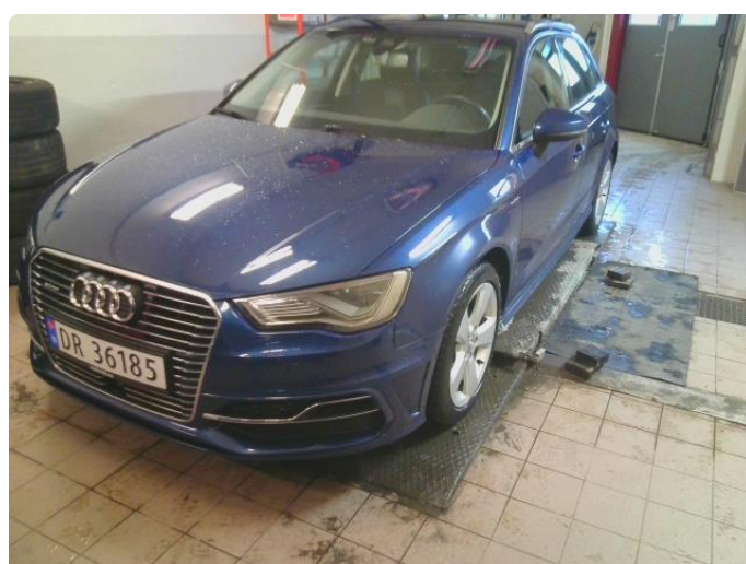
3.1 Øvrige feil