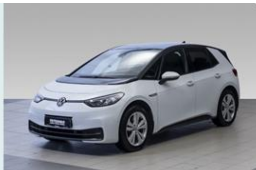
FRYDENBØ | Ålesund

Se mer om forutsetningene for vurderingen og andre vilkår på siste side.