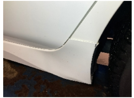
15. Lakk / karosseri utvendig