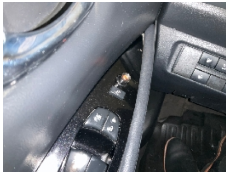
17. Utvendig speil