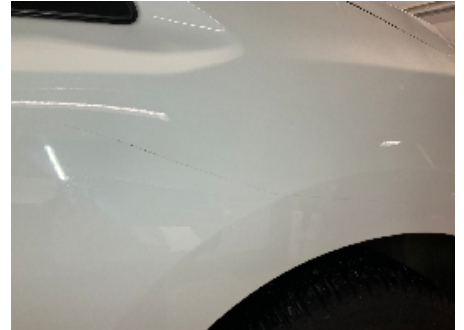
9. Lakk / karosseri utvendig