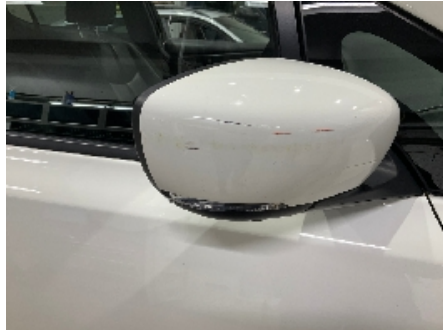
8. Utvendig speil