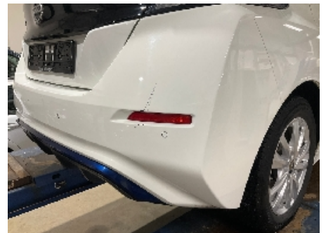
12. Lakk / karosseri utvendig