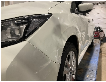
13. Lakk / karosseri utvendig