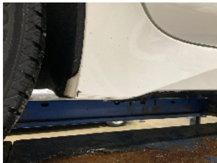
11. Lakk / karosseri utvendig