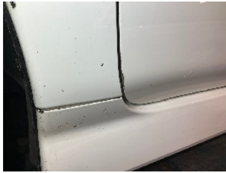
14. Lakk / karosseri utvendig