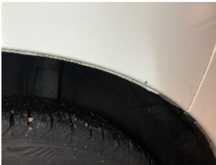
16. Lakk / karosseri utvendig