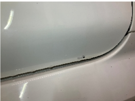
10. Lakk / karosseri utvendig