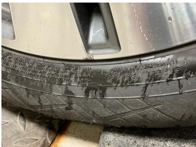
1.2 Små sår i to sommerfelger