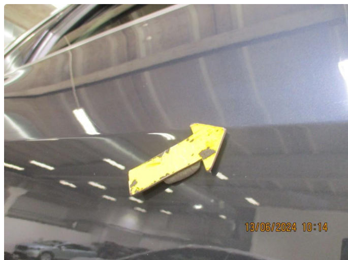
1.1 Parkeringsbult høyre bakdør