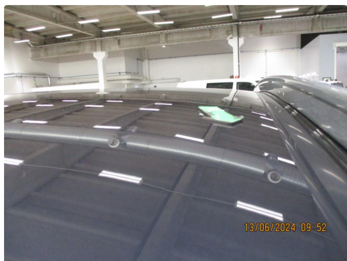
1.3 Liten bult tak