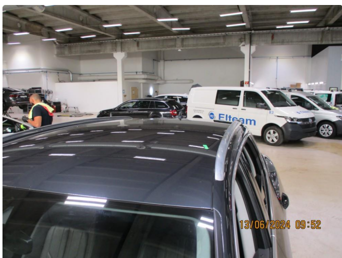
1.3 Liten bult tak