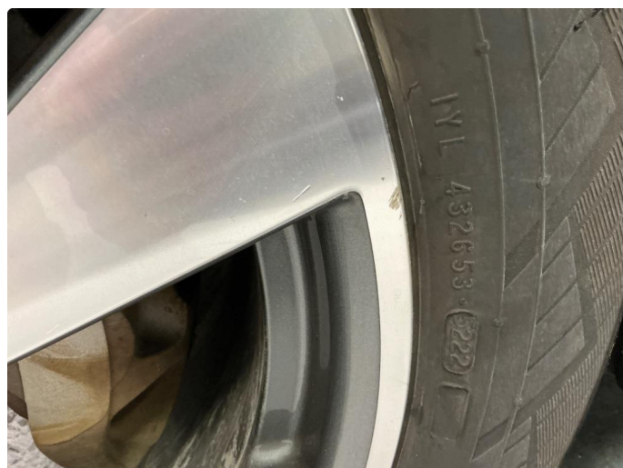
1.2 Små sår i to sommerfelger