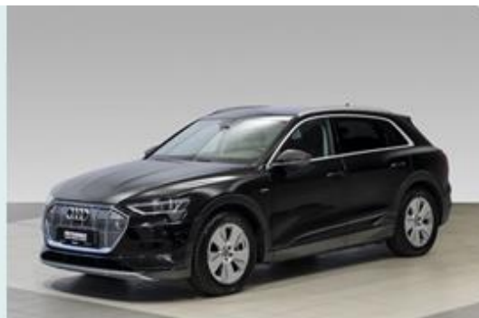
FRYDENBØ | Ålesund

Se mer om forutsetningene for vurderingen og andre vilkår på siste side.