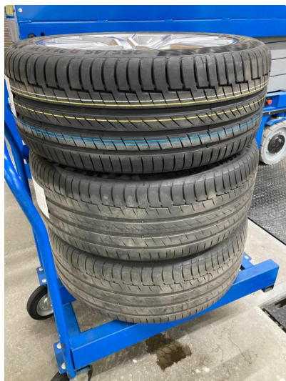
1.1 Øvrig opplysninger