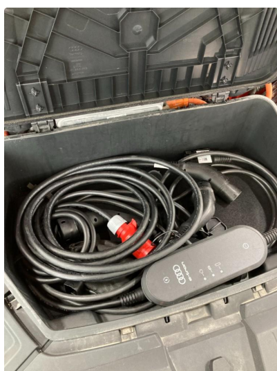
1.1 Øvrig opplysninger