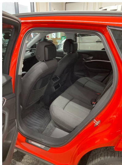
1.1 Øvrig opplysninger