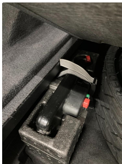
1.1 Øvrig opplysninger