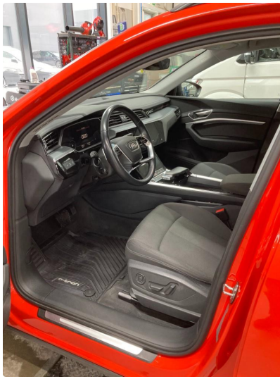
1.1 Øvrig opplysninger