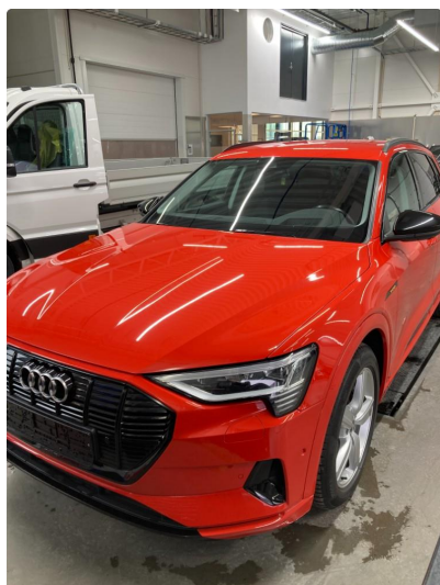
1.1 Øvrig opplysninger