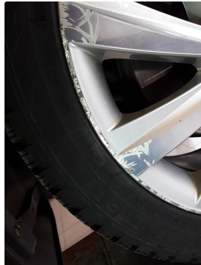
1.3 2 noe kantkjørte vinterfelger.