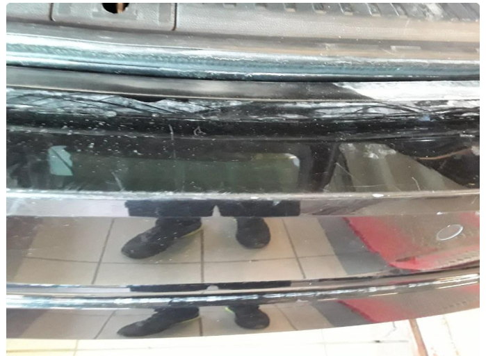
1.4 Noe riper.