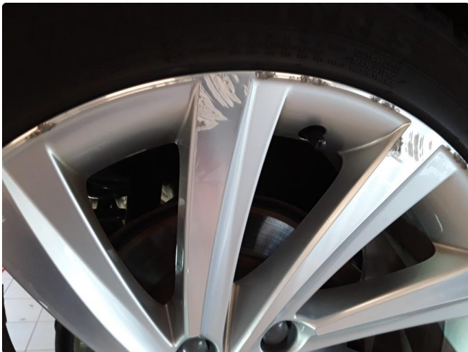
1.3 2 noe kantkjørte vinterfelger.