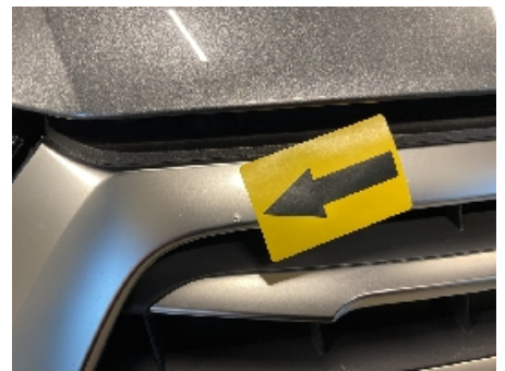
18. Lakk / karosseri utvendig