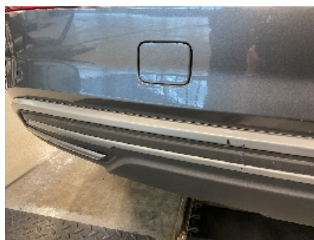
23. Lakk / karosseri utvendig