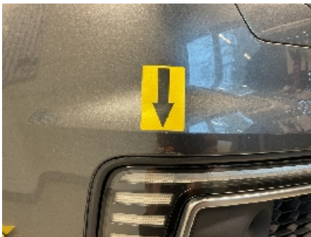
19. Lakk / karosseri utvendig