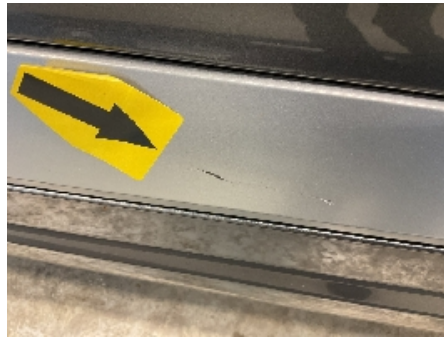
26. Lakk / karosseri utvendig