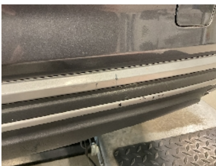
22. Lakk / karosseri utvendig