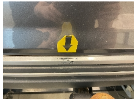
21. Lakk / karosseri utvendig