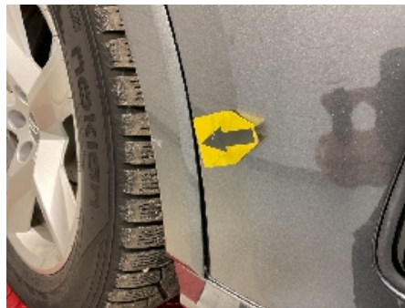
20. Lakk / karosseri utvendig