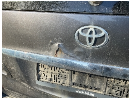
2. Lakk / karosseri utvendig