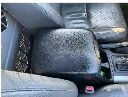
4. Dashbord / midtkonsoll