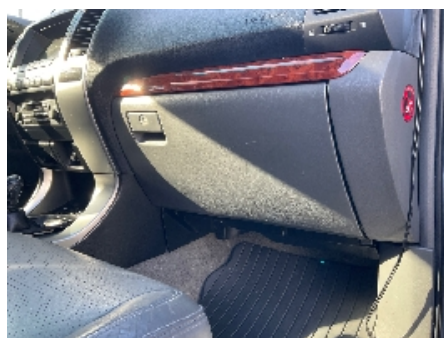
5. Dashbord / midtkonsoll