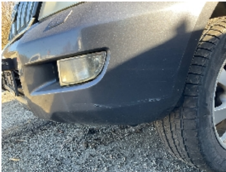
1. Lakk / karosseri utvendig