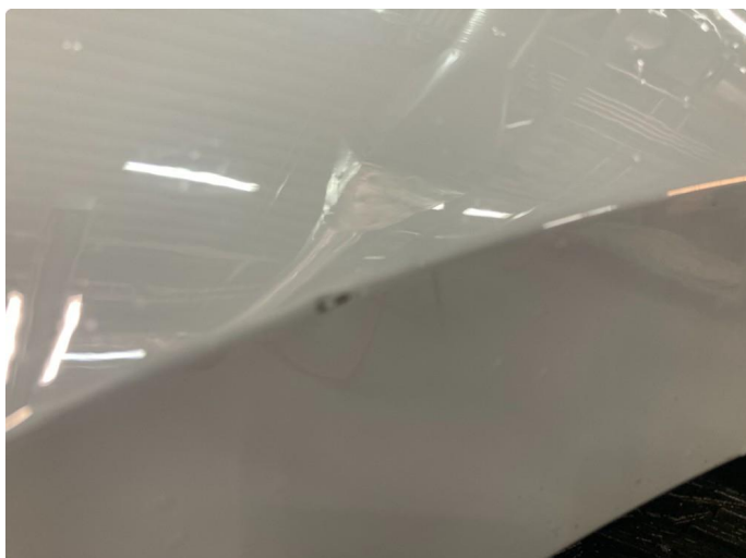
1.1 P-pulk venstre fram