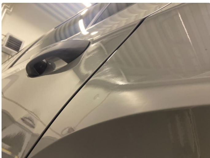
1.2 P-bulk venstre bak