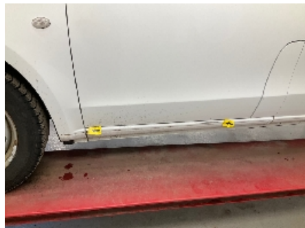
11. Venstre kanal