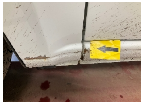
12. Venstre kanal