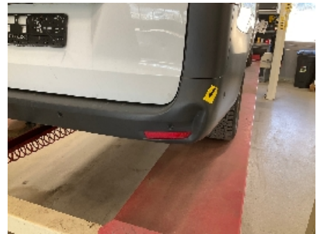
18. Støtfanger bak