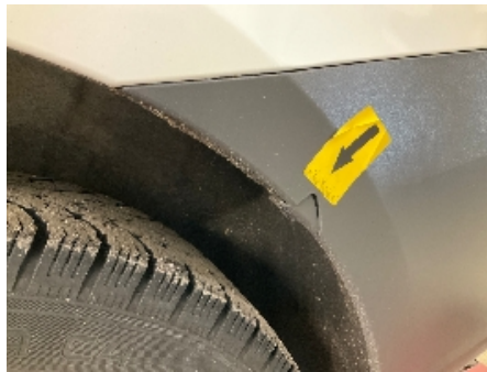
17. Støtfanger bak