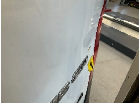
7. Lakk / karosseri utvendig