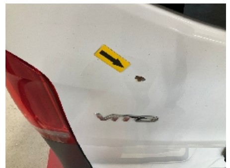
6. Lakk / karosseri utvendig