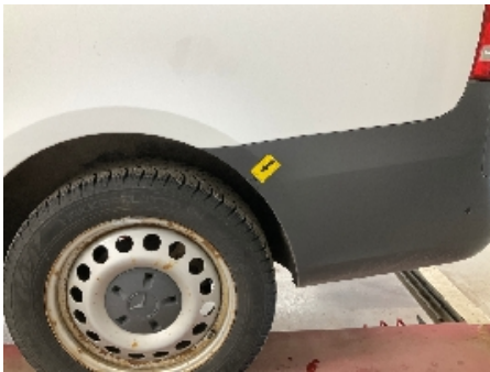
16. Støtfanger bak