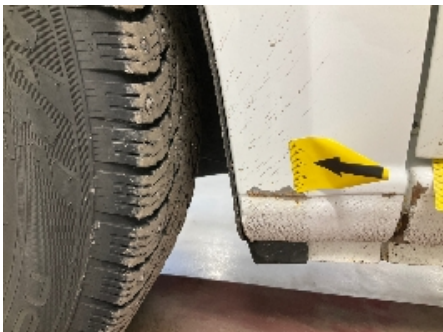
10. Venstre forskjerm