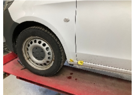
9. Venstre forskjerm