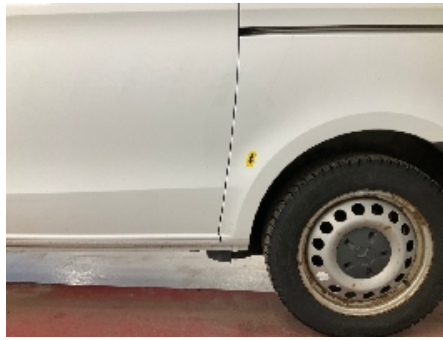
14. Venstre bakskjerm