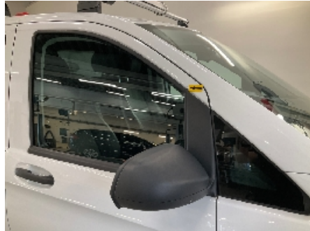
8. Høyre fordør