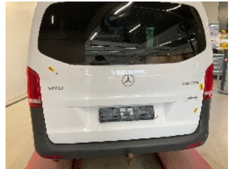
3. Lakk / karosseri utvendig