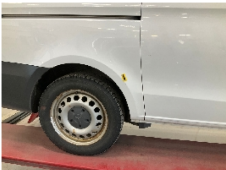
19. Høyre bakskjerm