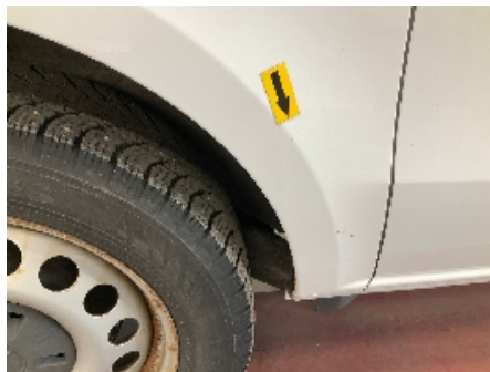
20. Høyre bakskjerm