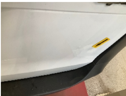
4. Lakk / karosseri utvendig