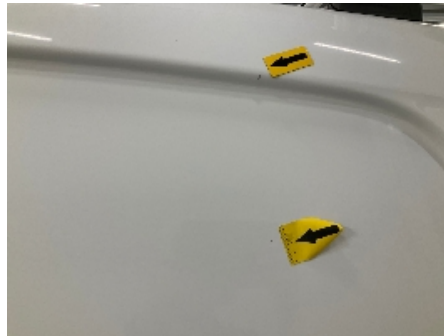
2. Karosseri generelt