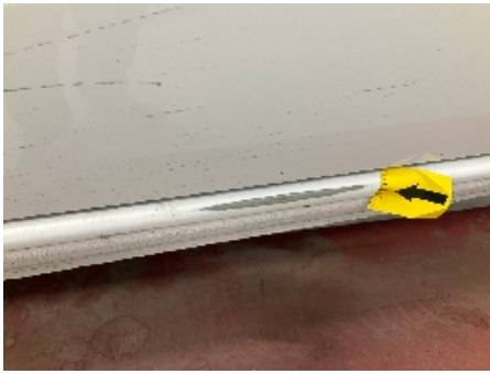
13. Venstre kanal