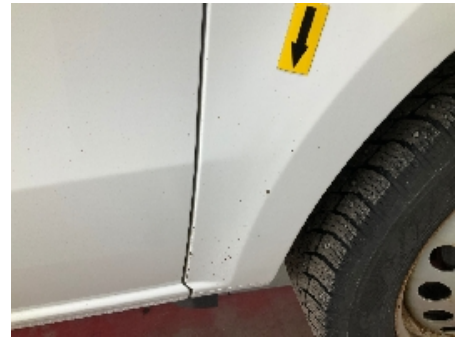
15. Venstre bakskjerm