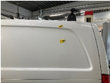
1. Karosseri generelt