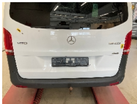
5. Lakk / karosseri utvendig