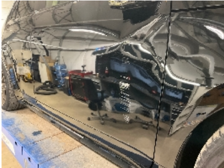
7. Lakk / karosseri utvendig