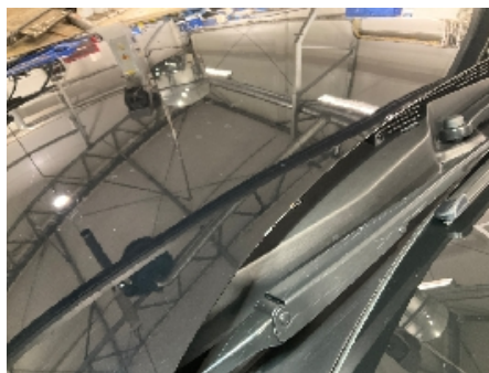
5. Lakk / karosseri utvendig