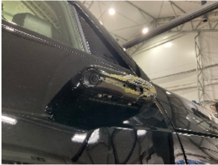
1. Utvendig speil