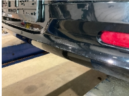
8. Lakk / karosseri utvendig