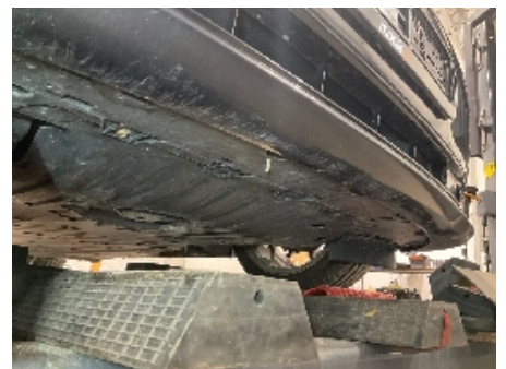
6. Lakk / karosseri utvendig