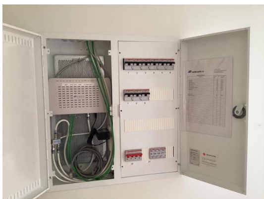
Sikringskap plassert på bod.