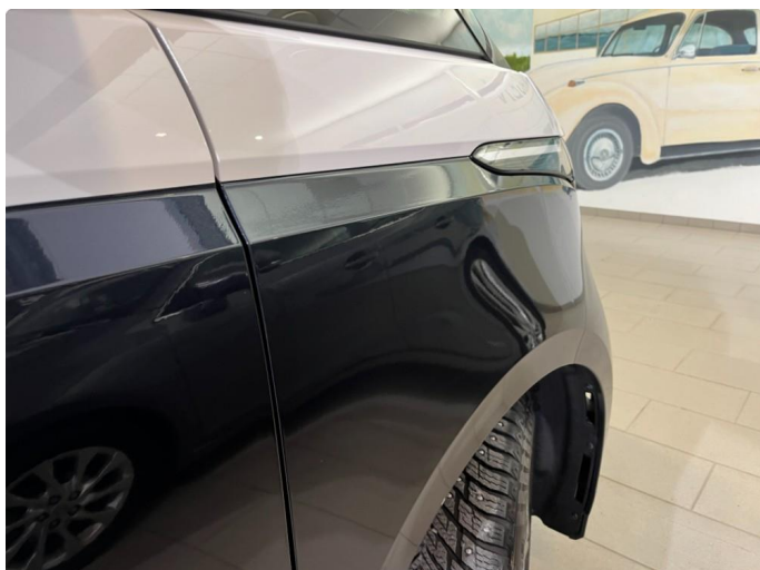
1.1 Ørliten bulk i høyre forskjerm, strengt tatt umulig å se den om man ikke vet om den.