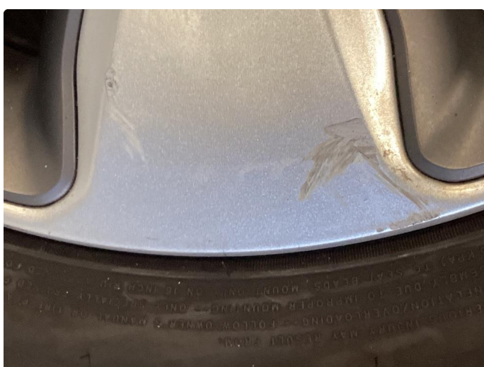
1.2 Kantkjørt felg