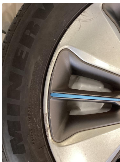
1.2 Kantkjørt felg