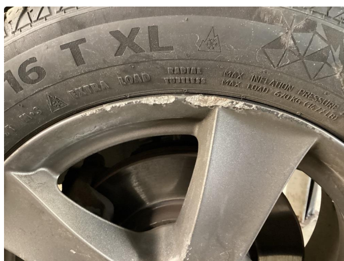
1.3 Kantkjørt felg