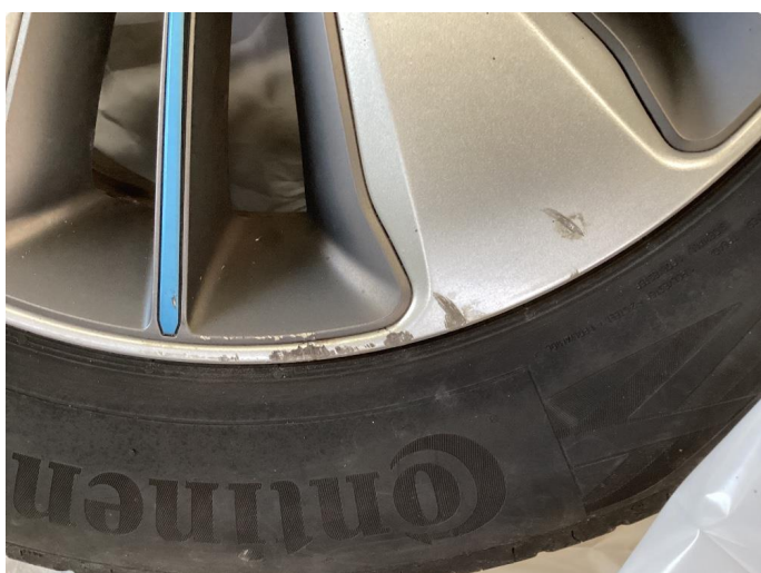
1.2 Kantkjørt felg