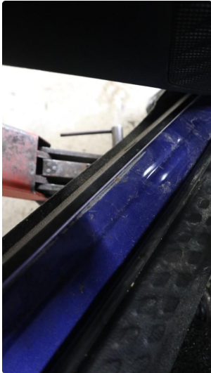
1.1 Slitt gjennom lakk