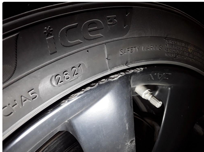
1.2 Noe kantskade på felg(er). Flekkes med lakkstift.