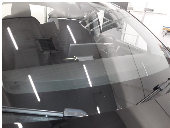
1.3 Steinslag i frontrute. Reparert og limt.