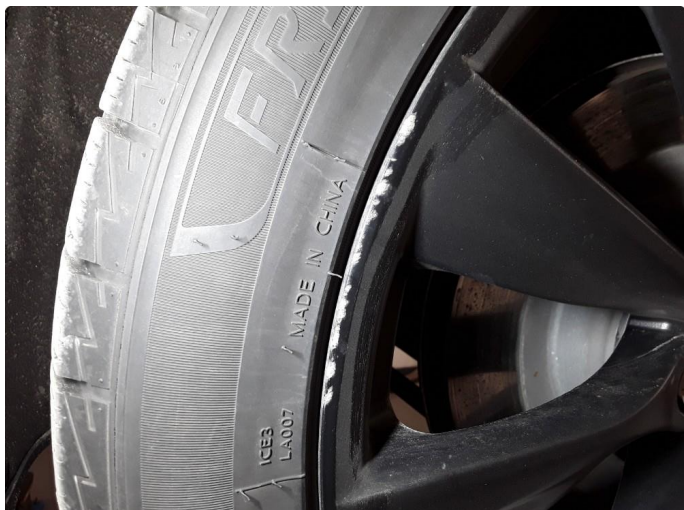
1.2 Noe kantskade på felg(er). Flekkes med lakkstift.