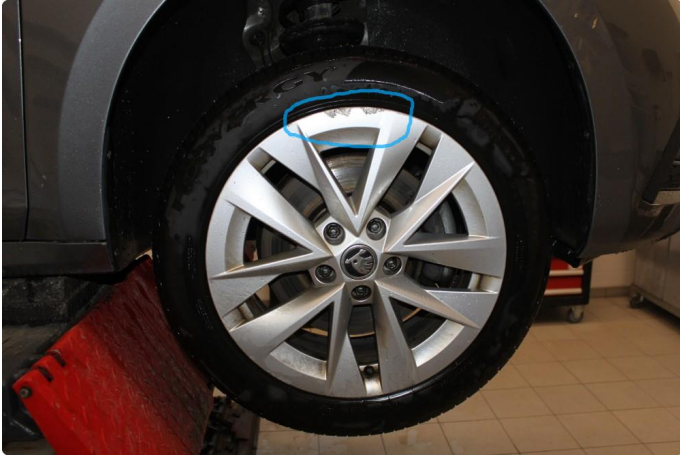
1.3 Kantkjørt felg