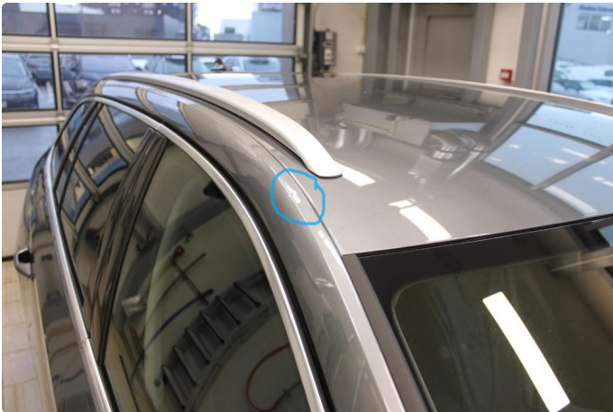
1.5 Liten bulk i slutten av A-stolpe.