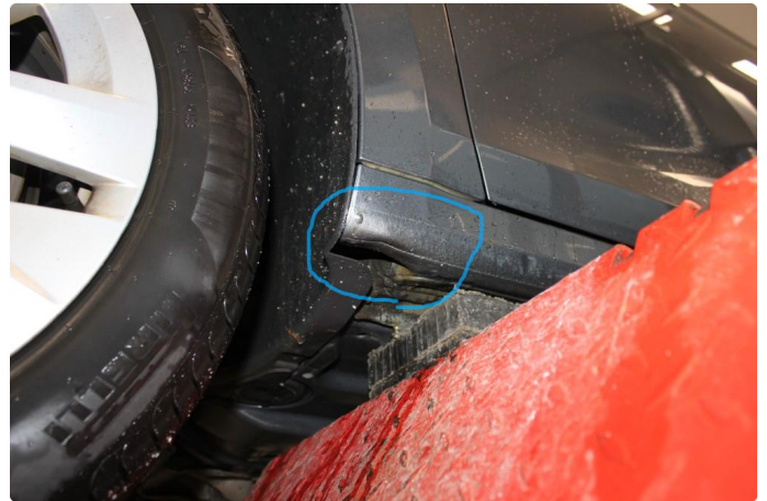
1.6 Liten skade i forkant av venstre kanal.