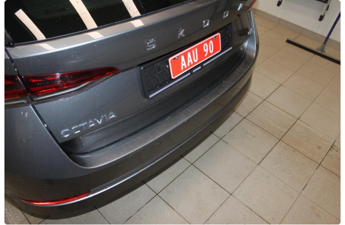
1.4 En del sår/riper på lastekant.