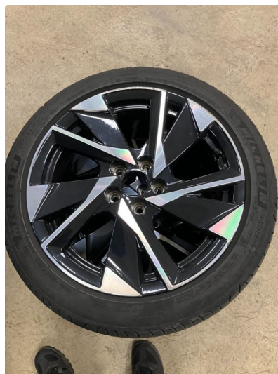
1.1 Kantkjørt felg Diamond Cut