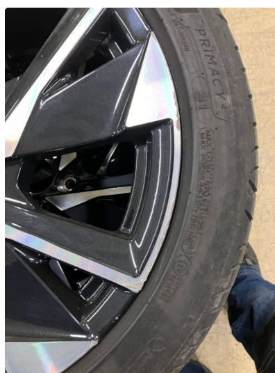
1.1 Kantkjørt felg Diamond Cut