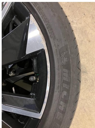
1.1 Kantkjørt felg Diamond Cut