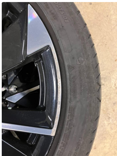
1.1 Kantkjørt felg Diamond Cut