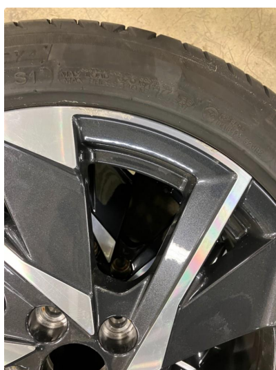
1.1 Kantkjørt felg Diamond Cut