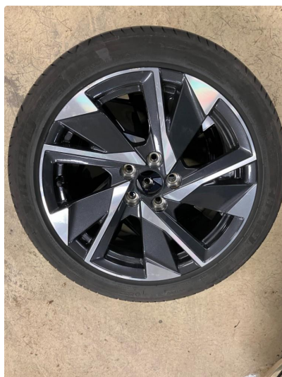
1.1 Kantkjørt felg Diamond Cut