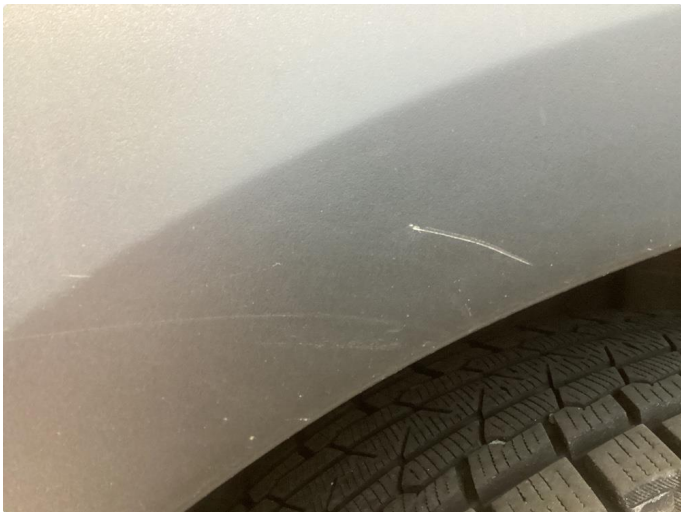
1.1 Noe riper