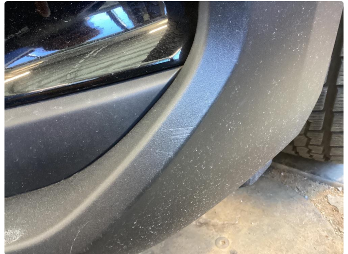
1.1 Noe riper