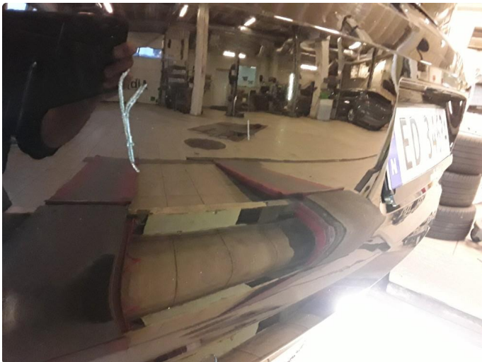
1.4 Noen riper.