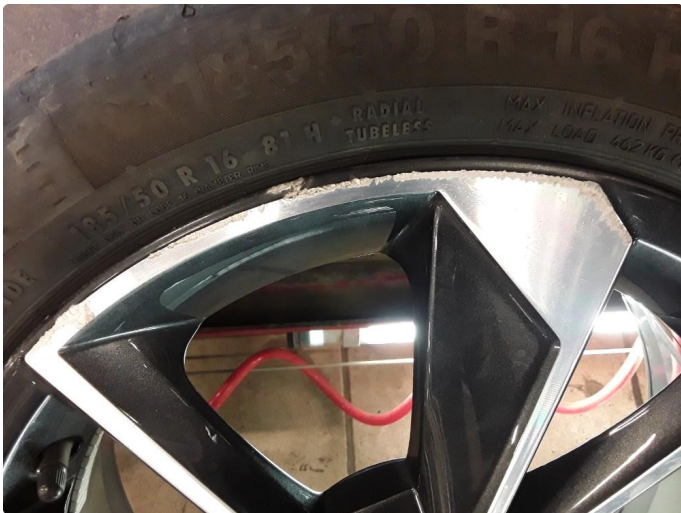
1.2 Noe kantkjørt sommerfelg.