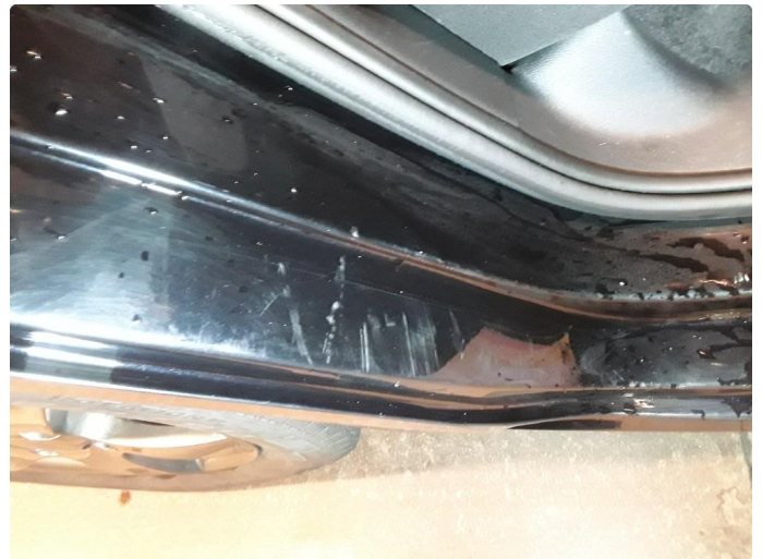
1.3 Noe riper.