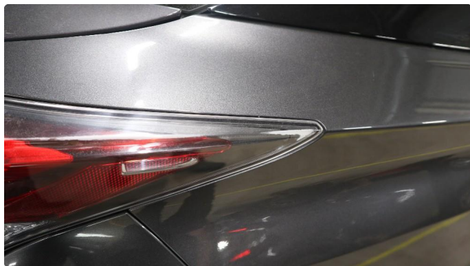
2.1 Øvrige feil