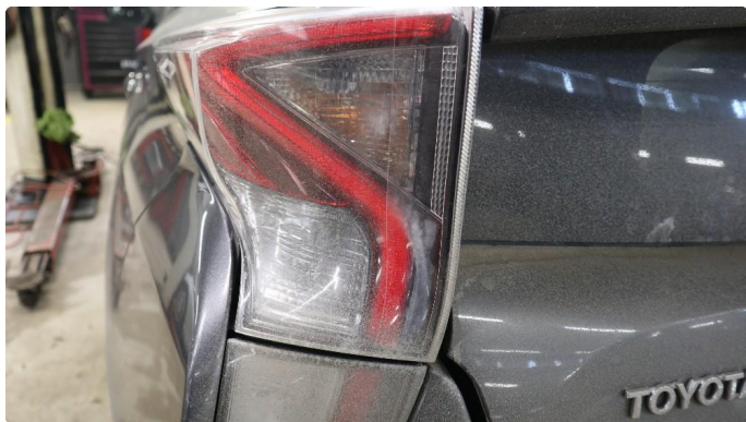
2.1 Øvrige feil