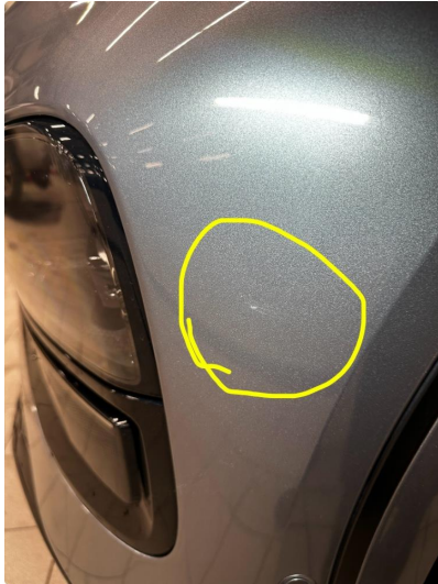
1.1 Bruks Merker