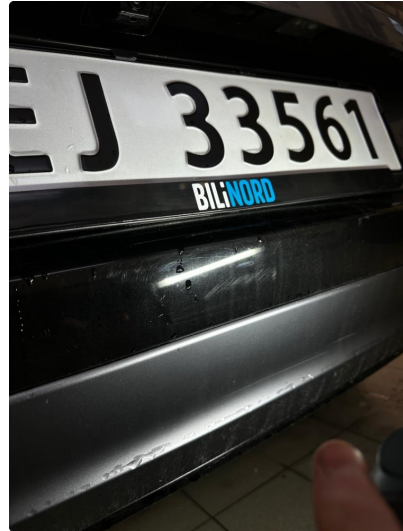
1.2 Bruks Merker